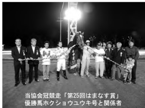
当協会冠競走「第25回はまなす賞」 優勝馬ホクショウユウキ号と関係者